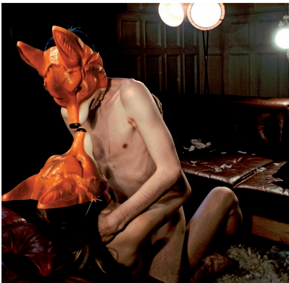
Marc Kiskas fotografier portretterer de bortkomne og lovløse skammens barn. På samme tid som bildene oser av uskyld og sårhet er de også en hyllest til den skeive anderledesheten.

Ektemannen går igjen som modell i bildene, og Marc forteller at han er en viktig aktør både foran og bak kamera.