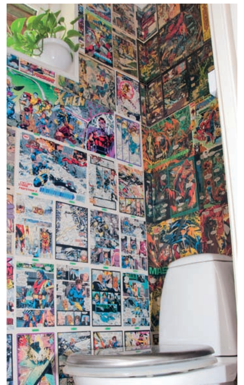
Å bygge et våtrom er ingen spøk, men paret tok oppgaven på strak arm. Det sparte de over 100 000 kroner på. Fotografiene til Marc henger over hele huset, unntatt på toalettet. Der er det superhelter som gjelder – Jeg vet ikke om det finnes noen homosuperhelter blant dem, sier Mac.